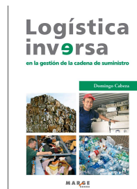
Logística inversa en la gestión de la cadena de suminis [...]