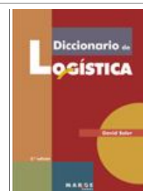
Diccionario de logística