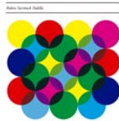
Economías transformadoras de Barcelona

L'economia social i solidària a Barcelona