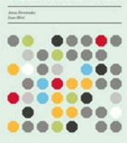
L'economia social i solidària a Barcelona