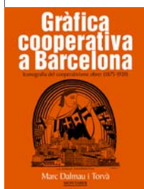
Gràfica cooperativa a Barcelona. Iconografia del cooper [...]