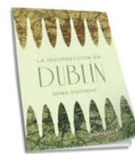
La insurrección en Dublín