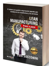
Lean Manufacturing. Paso a Paso