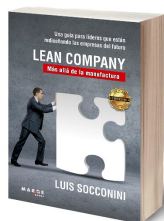
Lean Company. Más allá de la manufactura