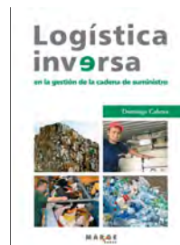
Logística inversa en la gestión de la cadena de suminis [...]