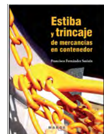
Estiba y trincaje de mercancías en contenedor