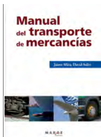
Manual del transporte de mercancías