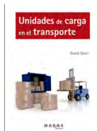
Unidades de carga en el transporte