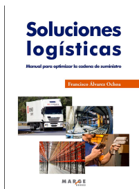
Soluciones logísticas para optimizar la cadena de sumin [...]