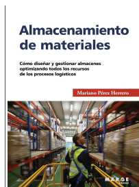
Almacenamiento de materiales