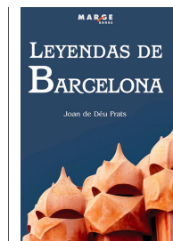
Leyendas de Barcelona