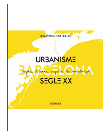
Barcelona. Urbanisme segle XX