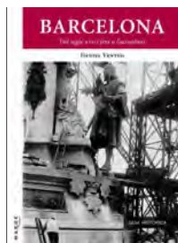
Barcelona. Del segle XVIII fins a l'actualitat