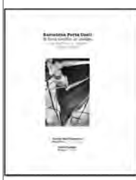
Barcelona Porta Coeli. El front marítim en imatges (197 [...])