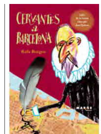
Cervantes a Barcelona