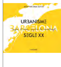
Barcelona. Urbanisme segle XX