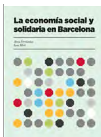
La economía social y solidaria en Barcelona