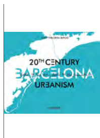
Barcelona. 20th Century Urbanism