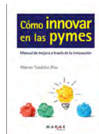
Cómo innovar en las pymes. Manual de mejora a través de [...]